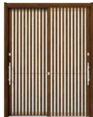
YF: キャラメルチーク