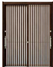
Z9: ショコラウォールナット