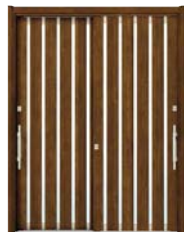
YF: キャラメルチーク