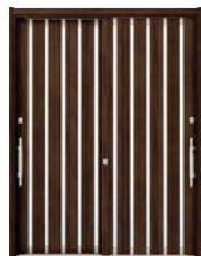
Z9: ショコラウォールナット