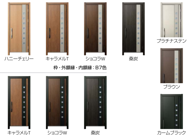
枠・外額縁・内額縁：B7色